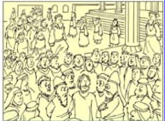
Saint Elizabeth Church Parroquia de Santa Isabel

Jesus was sad for the city of Jerusalem. "Oh Jerusalem, Jerusalem," He said.